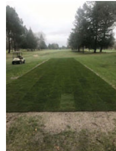
Départ du 2 gazonné

Aujourd'hui, 7 départs ont été entièrement gazonnés : 2, 3, 4, 6, 7, 12, 18, en gazon roulé provenant du même fournisseur que le FC de Barcelone 😊