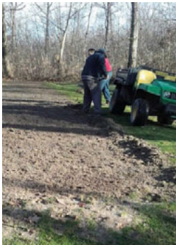
Réfection du départ trou 3