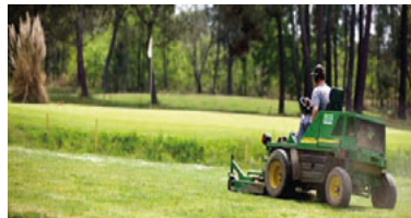
Ratissage départ du 12 avant gazon